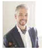
サルヴァトーレ・ピエーディスカルツイ(Vn)

クラシックの音楽を、様々なジャンルでアレンジします。オリジナルVSアレンジの世界で、異国情緒溢れる世界をお楽しみください。